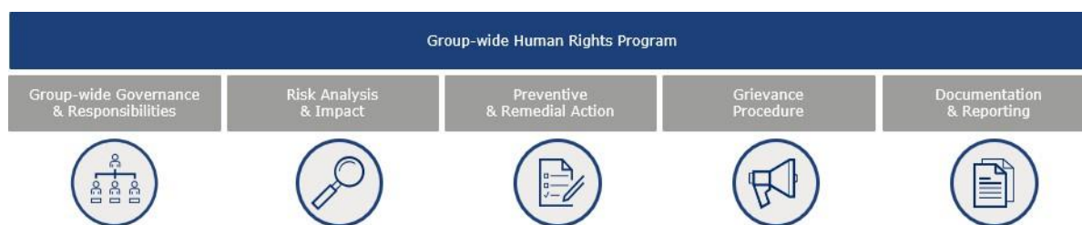
Gráfico 1: Los cinco pilares de nuestro Programa de Derechos Humanos

Nuestra debida diligencia en materia de derechos humanos, para nuestras propias operaciones y cadenas de suministro, se basa en cinco pilares: